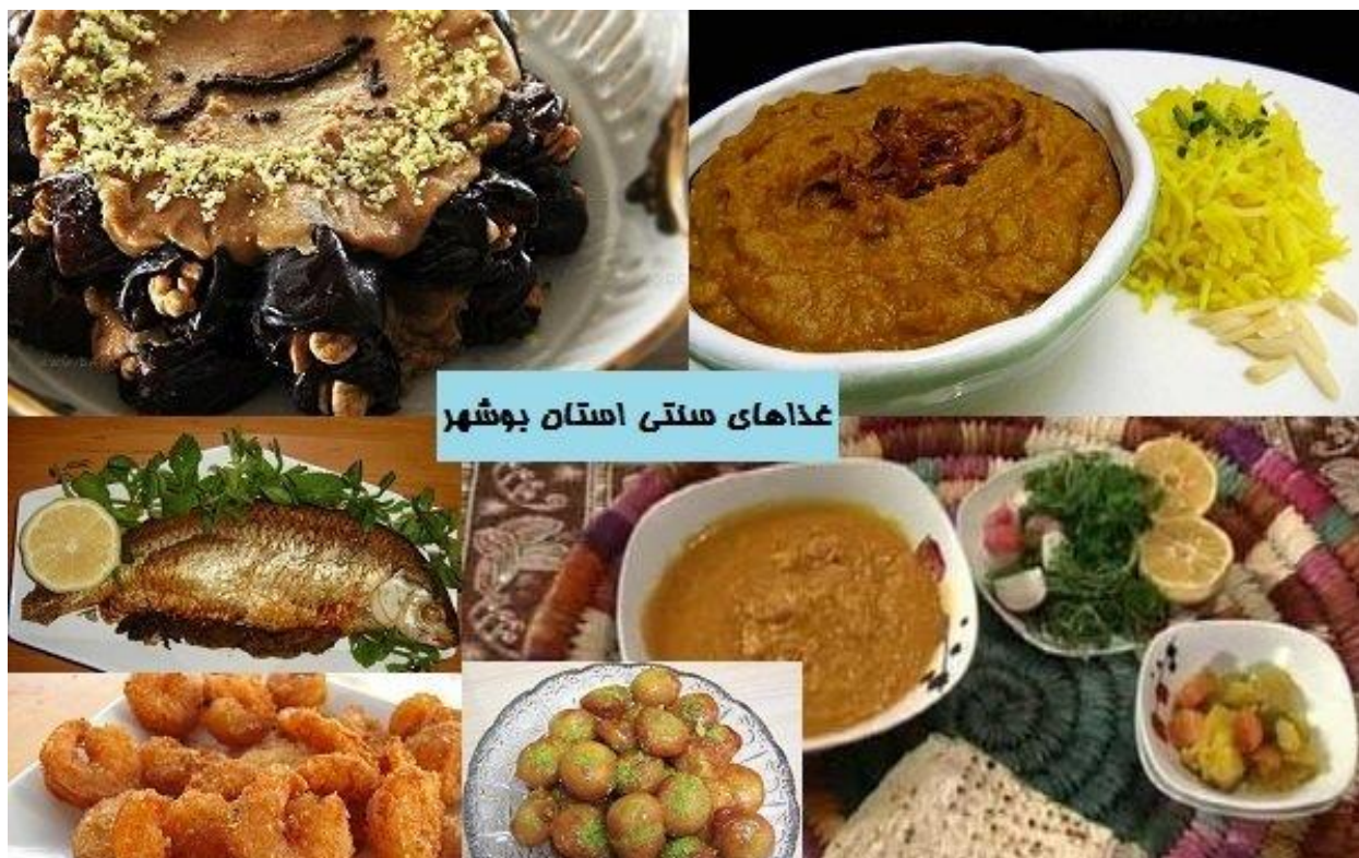
غذاهای سنتی استان بوشهر