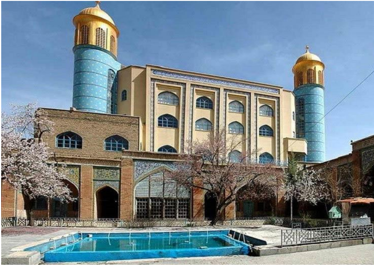
مسجد جامع سنندج