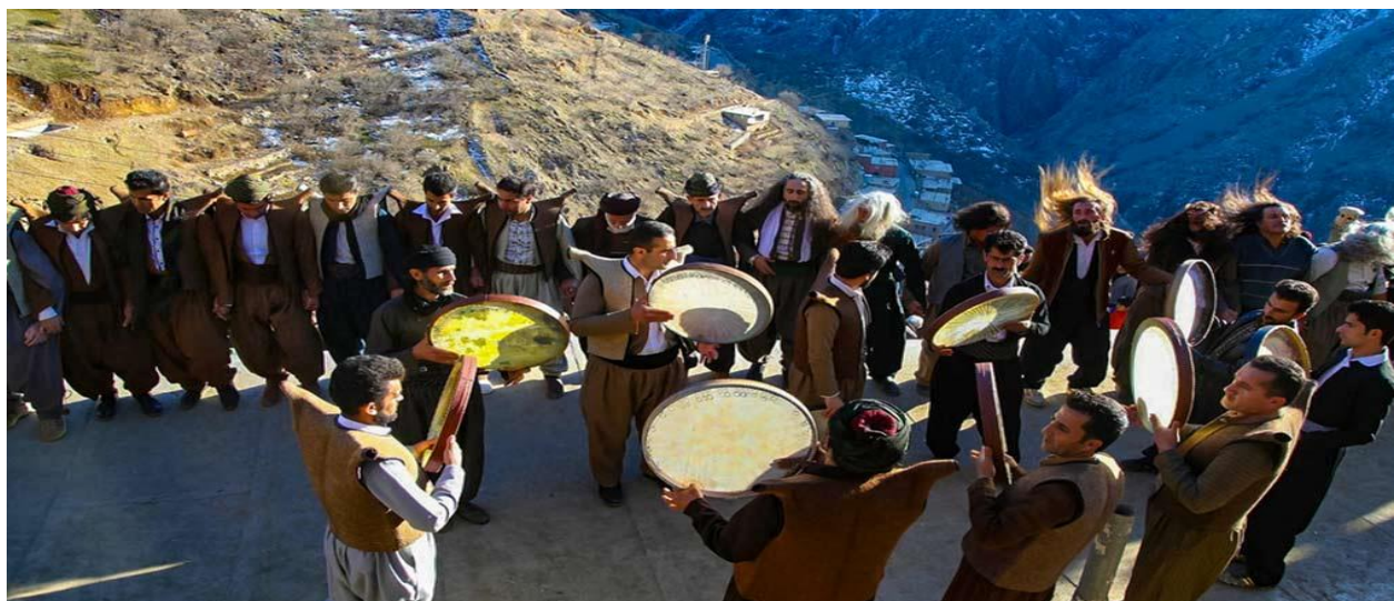
آیین پیر شالیار

این آیین چهار رسم اصلی دارد. خبر دادن، قربانی کردن حیوانات، مراسم دف‌زنی و سماع. یک‌هفته بعد از مراسم نیز به زیارت درگذشتگان می‌گذرد. هرچند نام این مراسم با عروسی همراه است، در آن دف نواخته می‌شود و رقص‌های محلی توسط مردان اجرا می‌شود. اما بخش زیادی از آن نیز به شکرگزاری و پرستش خدا می‌گذرد. از نظر «لی»، جذابیت دیگر این مراسم این است که همه‌ی نسل‌های روستا از مسن‌ترین افراد تا کودکان در آن شرکت می‌کنند و نسبت به آن علاقه نشان می‌دهند.