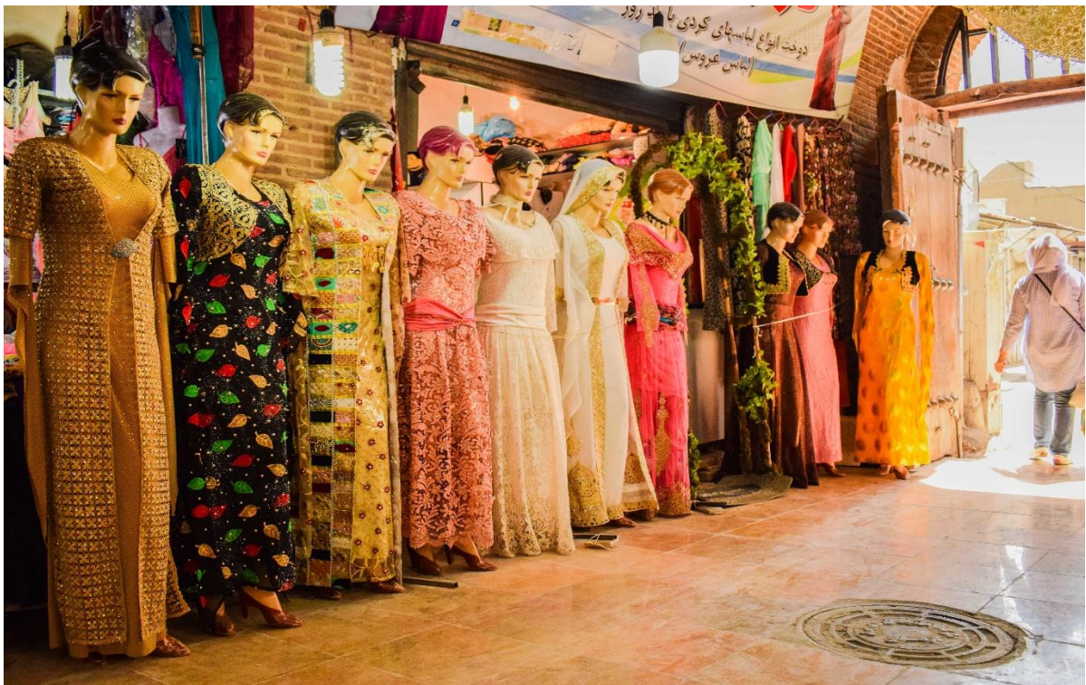
لباس‌های محلی زنان کرد