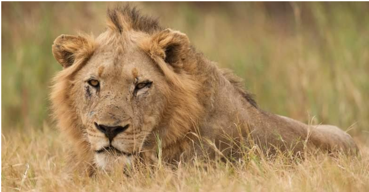
پارک ملی کروگر

«پارک ملی کروگر» یکی از بهترین و غنی ترین مناطق گردشگری طبیعی در آفریقا و یکی از قدیمی ترین ها در آفریقای جنوبی است. اگر عاشق حیات وحش هستید، قطعاً این پارک معروف باید در برنامه سفر شما به آفریقای جنوبی باشد.