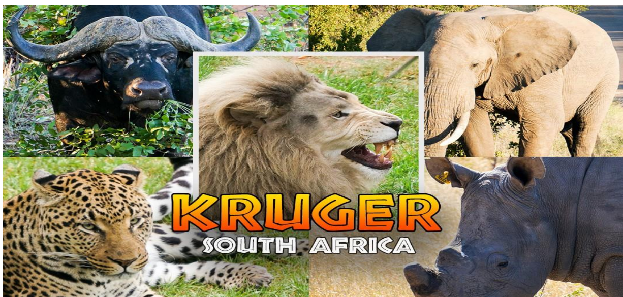
پارک ملی کروگر

آفریقای جنوبی به غیر از پارک های معروف «کروگر» و پارک بین المللی «کالاهاری»، مجلل ترین و غنی ترین مناطق گردشگری طبیعی جهان را در خود جای داده است. دوستداران حیات وحش در جستجوی حیواناتی مانند شیر، بوفالو، پلنگ، کرگدن و فیل از گوشه و کنار جهان به آفریقای جنوبی سفر می کنند.