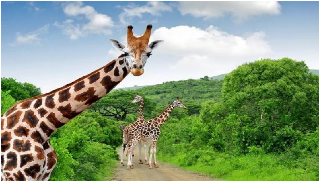
حیوانات پارک ملی کروگر

پارک ملی کروگر به دلیل کمیت و تنوع استثنایی حیات وحش قابل توجه می باشد. این پارک ۱۱۴ گونه مختلف خزنده را در خود جای داده است. بیش از ۵۰۰ گونه پرنده و ۱۴۷ پستاندار از جمله شیر، پلنگ، بوفالو، فیل و کرگدن. از گونه های دیگر می توان به گورخر، زرافه ، ایمپالا، یوزپلنگ و اسب آبی اشاره کرد. این پارک همچنین یکی از آخرین پناهگاه های گونه های در معرض خطر از جمله کرگدن سیاه و سگ وحشی آفریقایی است.