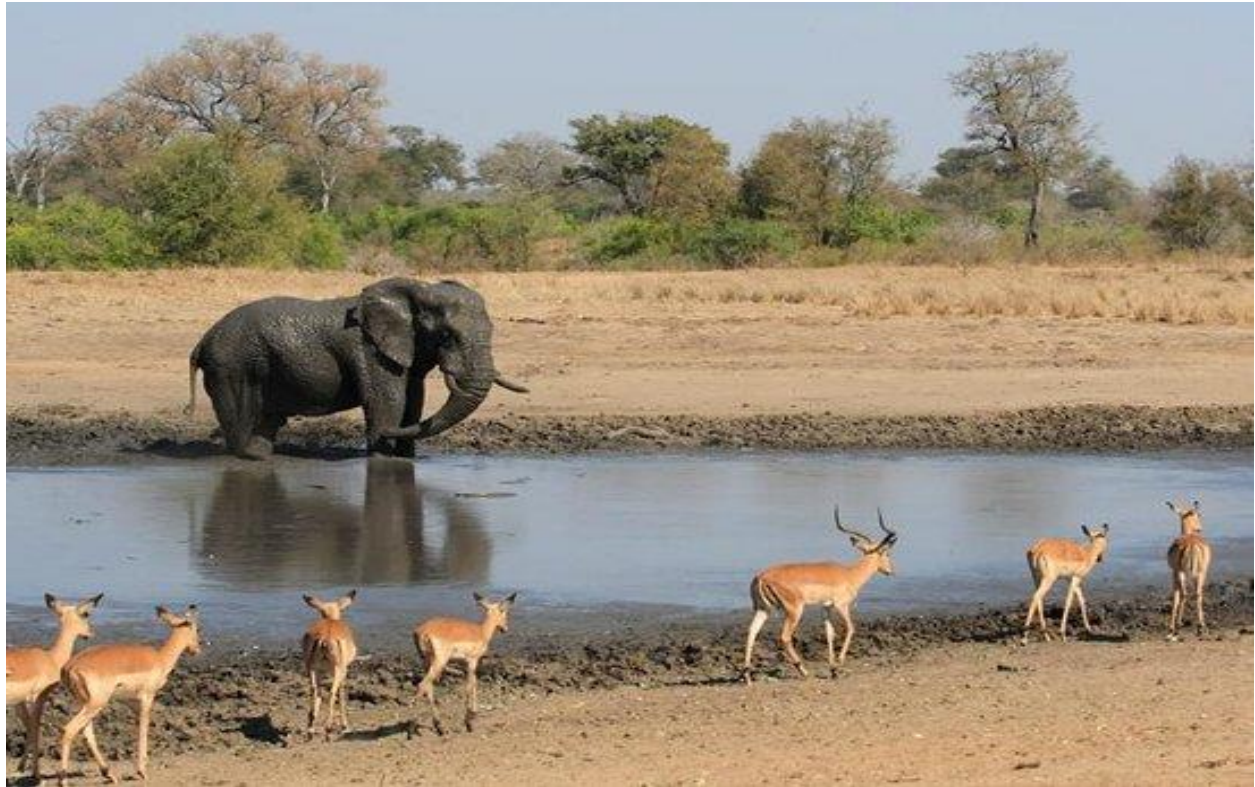
تنوع گونه های جانوری در پارک ملی کروگر

این پارک در استان های میپومالانگا و لیمپوپو واقع شده و حدود ۳,۵ تا ۴,۵ ساعت رانندگی از ژوهانسبورگ فاصله دارد. این پارک به بازدیدکنندگان فرصت دیدن شیر، پلنگ، گاومیش، فیل و کرگدن را می دهد. همچنین تنوع حیرت انگیزی از سایر حیوانات وحشی را برای مخاطب به نمایش می گذارد. این مکان همچنین محل نقاشی های سنگی باستانی و مکان های باستانی سان (بوشمن) است.