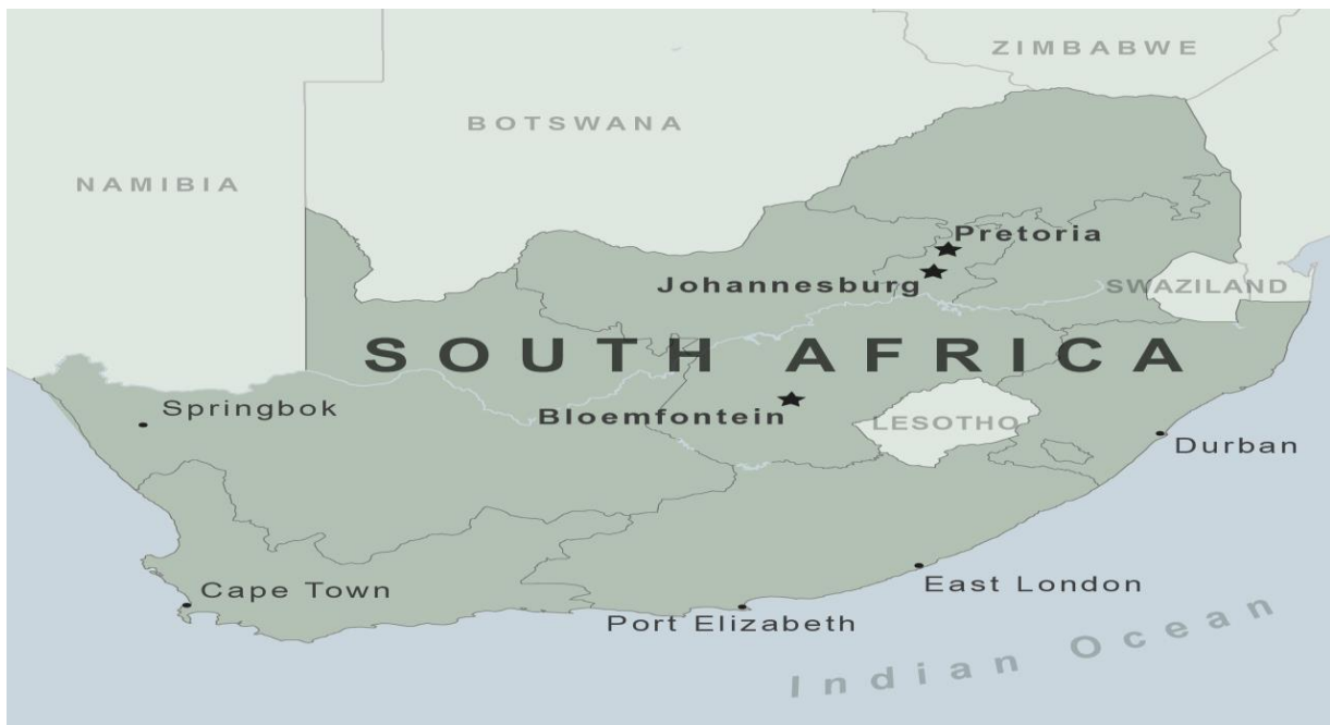
موقعیت جغرافیایی آفریقای جنوبی

خط ساحلی آفریقای جنوبی از جنوب با ۲,۷۹۸ کیلومتر (۱,۷۳۹ مایل) در امتداد اقیانوس اطلس جنوبی و اقیانوس هند امتداد یافته است. از شمال توسط کشورهای همسایه نامیبیا، بوتسوانا و زیمبابوه؛ از شرق و شمال شرقی توسط موزامبیک و اسواتینی (سوازیلند سابق) و کشور مستعمره لسوتو احاطه شده است. آفریقای جنوبی، جنوبی ترین کشور در سرزمین اصلی دنیای قدیم یا نیمکره شرقی است. این کشور پرجمعیت ترین کشور می باشد که کاملاً در جنوب خط استوا واقع شده است. آفریقای جنوبی با تنوع گونه های زیستی بی نظیر و پوشش گیاهی منحصر بفرد یک کانون تنوع زیستی به حساب می آید.