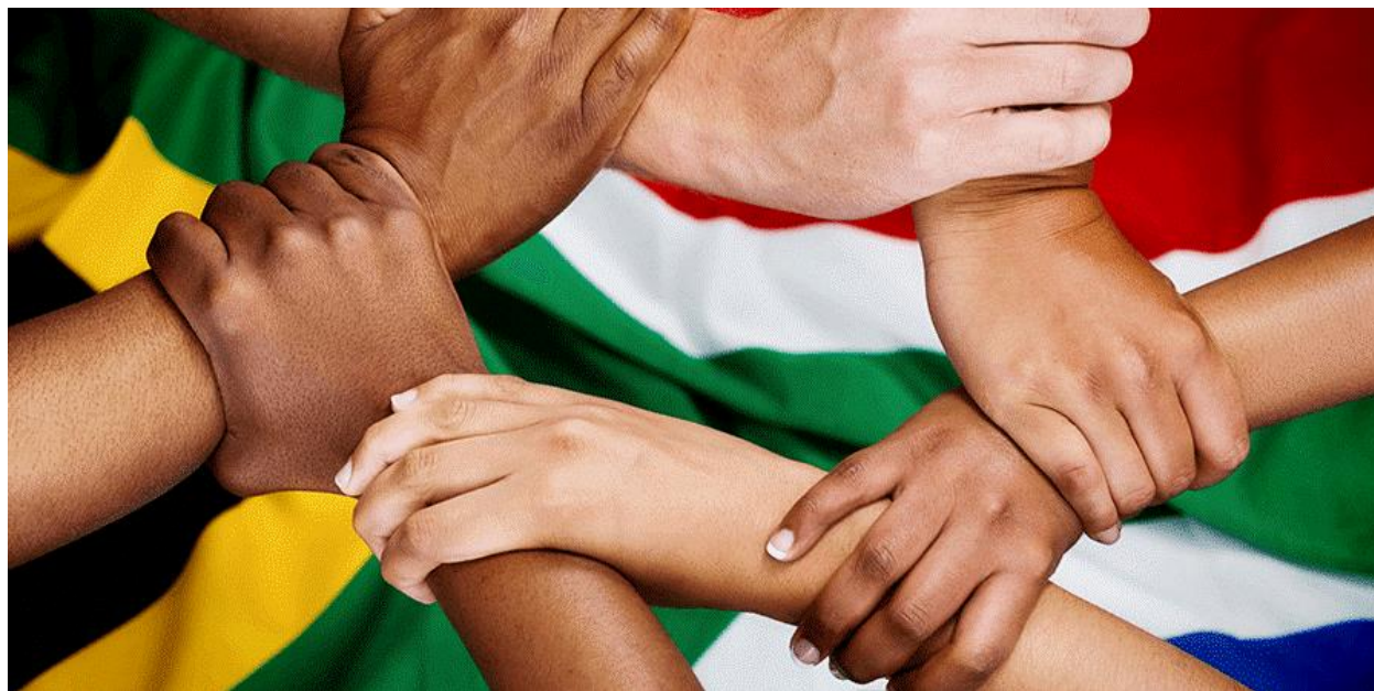
آفریقای جنوبی، کشوری چند ملیتی

استعمار انگلیس است و معمولاً در زندگی عمومی و تجاری مورد استفاده قرار می گیرد. این کشور در قاره آفریقا از معدود کشورهایی است که هرگز کودتا نکرده و تقریباً یک قرن است که به طور منظم در این کشور انتخابات برگزار می شود. با این حال، اکثریت قریب به اتفاق سیاه پوستان آفریقای جنوبی تا سال ۱۹۹۴ میلادی حق رای نداشتند.