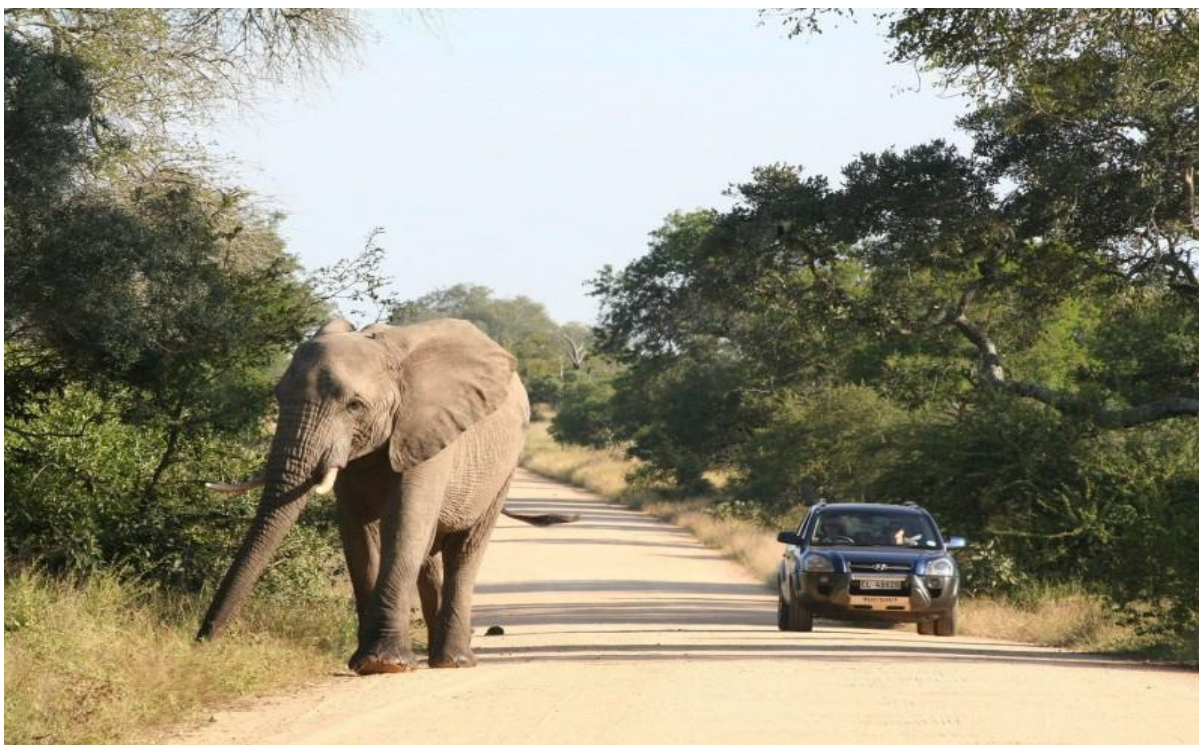
جاده سفر شخصی پارک ملی کروگر

شرکت های مسافرتی در ژوهانسبورگ، دوربان و نلسپروت با اتوبوس های داری تهویه مطبوع، تورهای پارک ملی کروگر را اجرا می کنند.