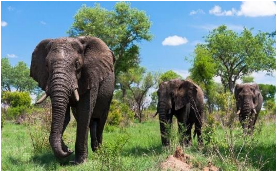
پارک ملی کروگر

آب و هوای پارک ملی کروگر نیمه گرمسیری و خشک ترین ماه های آن ژوئن، جولای، آگوست است. این ماه ها بهترین زمان سال برای بازدید از پارک است، زمانی که روزها آفتابی و گرم و شب ها نیز خنک تر است. در این ایام سال بسیاری از درختان و درختچه ها برگ های خود را از دست داده، منابع آب خشک می شوند و باعث می شود تا بتوانید بهتر در اطراف آب چاله های باقی مانده گشت و گذار کنید. بهار و تابستان زیبایی خاص خود را به ارمغان می آورد. باران های بهاری مناظر را شستشو می دهد. در تابستان، هنگامی که بیشتر باران می بارد، مناظر خشک و غبارآلود به سبزی پر جنب و جوش تبدیل می شوند و پس زمینه ای رنگارنگ و جذاب برای عکس ها ایجاد می کنند.