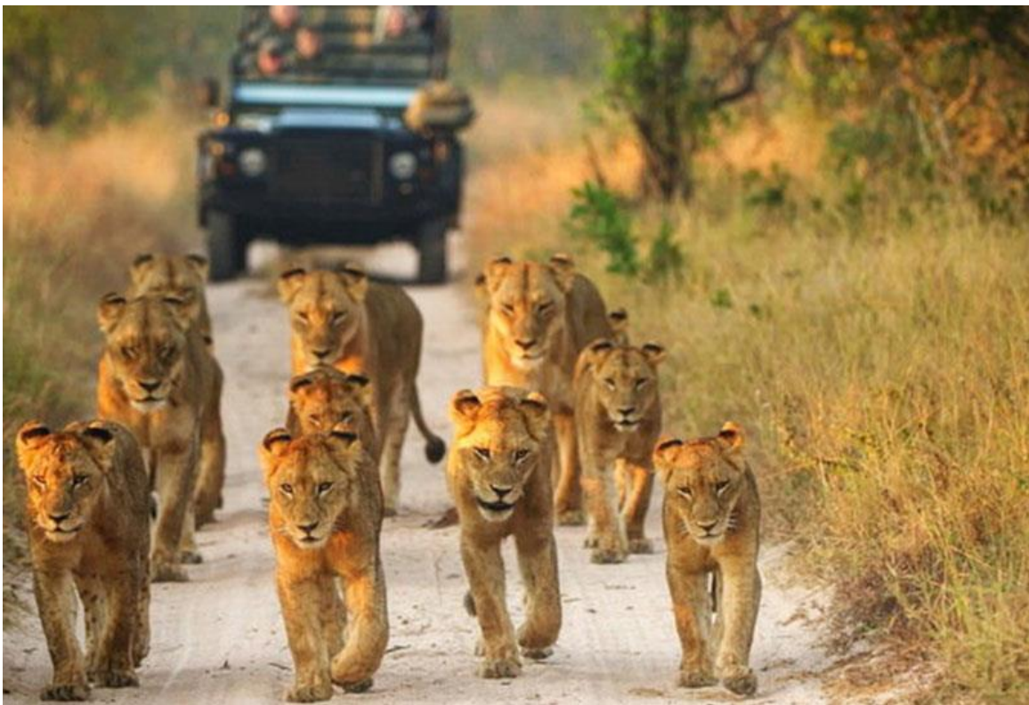
حیوانات پارک ملی کروگر