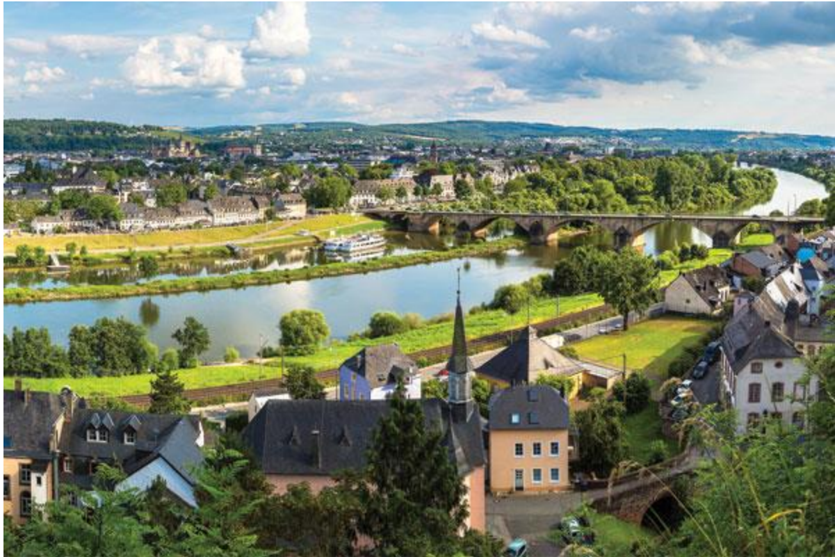
نمایی از شهر باستانی تریر

تریر، قدیمی ترین شهر آلمان است که زمانی مستعمره امپراتوری روم به شمار می آمد. این شهر امروزه با وجود جاذبه های تاریخی منحصر بفرد خود هر ساله پذیرای گردشگرانی از کشورهای مختلف است.