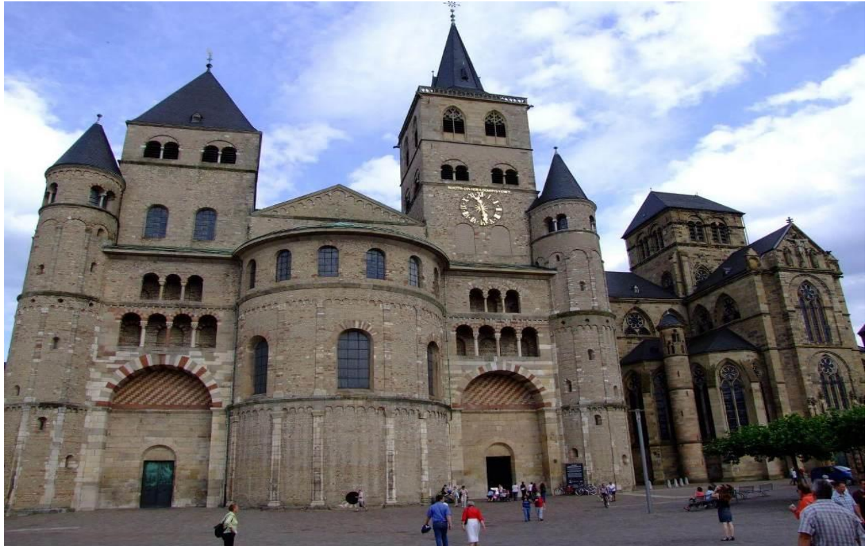
کلیسا جامع تریر

کلیسای جامع تریر که ۱۷۰ سال پیش ساخته شده است، به عنوان یکی از قدیمی ترین کلیساهای آلمان شناخته می شود. شاید برایتان جالب باشد که بدانید، تریر در دوره‌ای به دلیل تعداد زیاد کلیساهای و صومعه‌ها پیشوند «شهر مقدس» را گرفت. در آن زمان، کلیسای «لیب فراون»، به عنوان یکی از اولین سازه‌های گوتیک در آلمان، در کنار کلیسای جامع تریر ساخته شد.