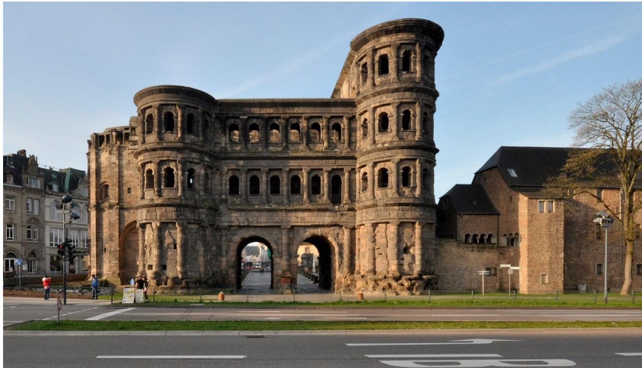
دروازه پورتا نیگرا