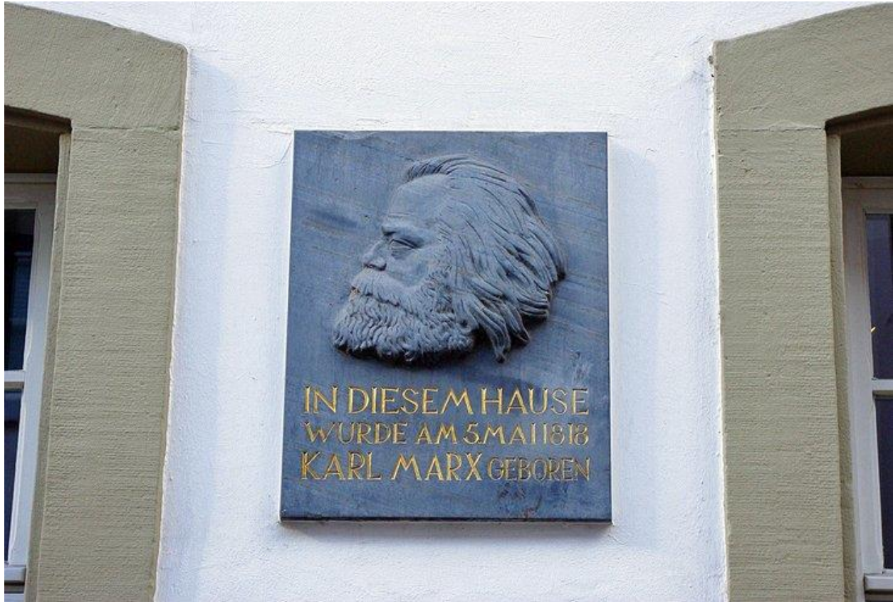
خانه کارل مارکس

همچنین جالب است بدانید که کارل مارکس، اقتصاددان و نظریه‌پرداز اجتماعی نیز اهل شهر تریر است و هر ساله نمایشگاه‌هایی درباره زندگی و آثار او در خانه محل تولدش برگزار می‌شود.