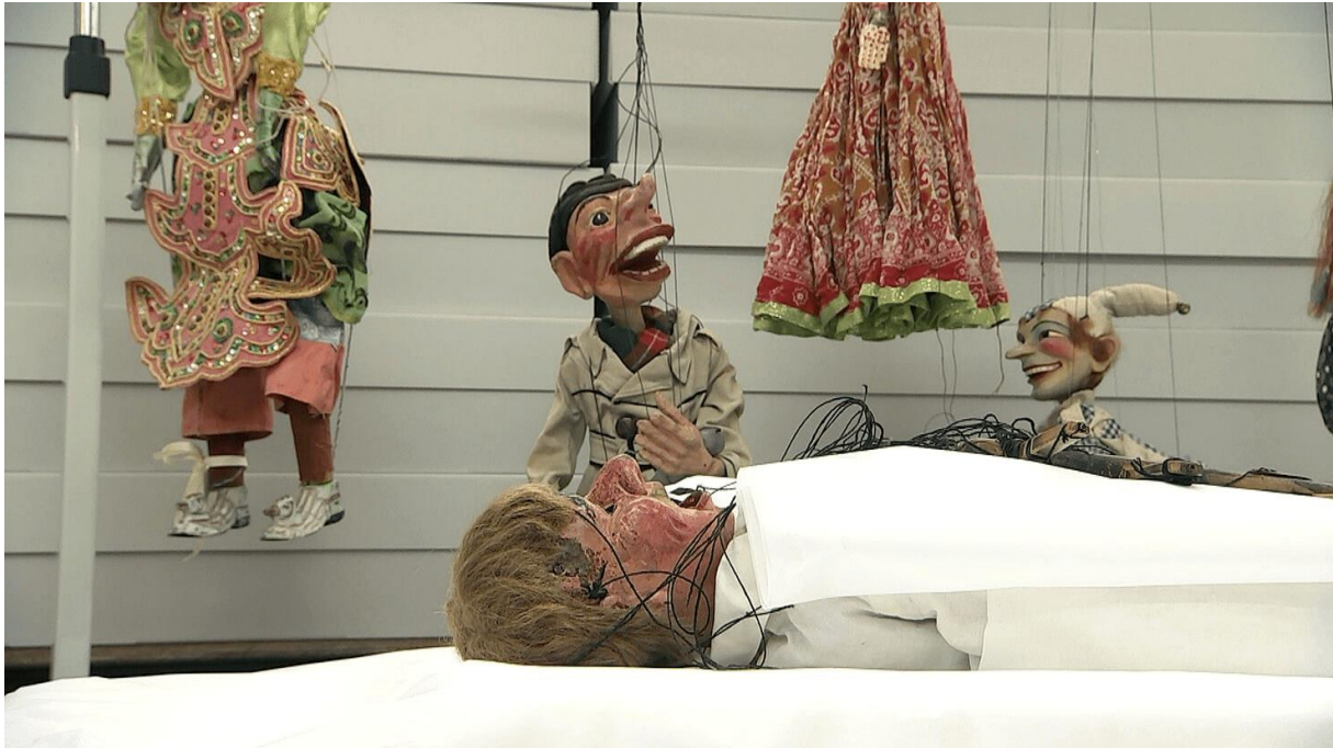
مجموعه تئاتر عروسکی درسدن

در تنظیم این مطلب از منبع ذیل استفاده شده است: