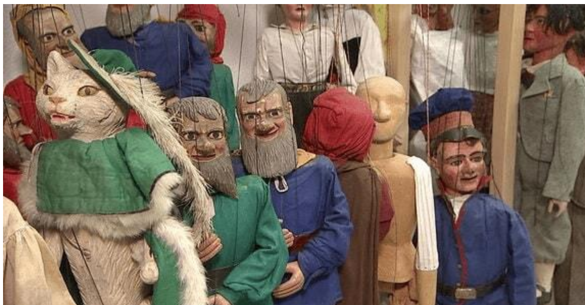
مجموعه در سدن با ۱۲ هزار عروسک

مجموعه تئاتر عروسکی در سدن با بیش از ۱۲ هزار عروسک، یکی از بزرگترین مجموعه‌های تئاتر عروسکی در سطح جهان است. این مجموعه روایتگر تاریخ تئاتر عروسکی از قرن هجدهم تا به امروز می باشد.