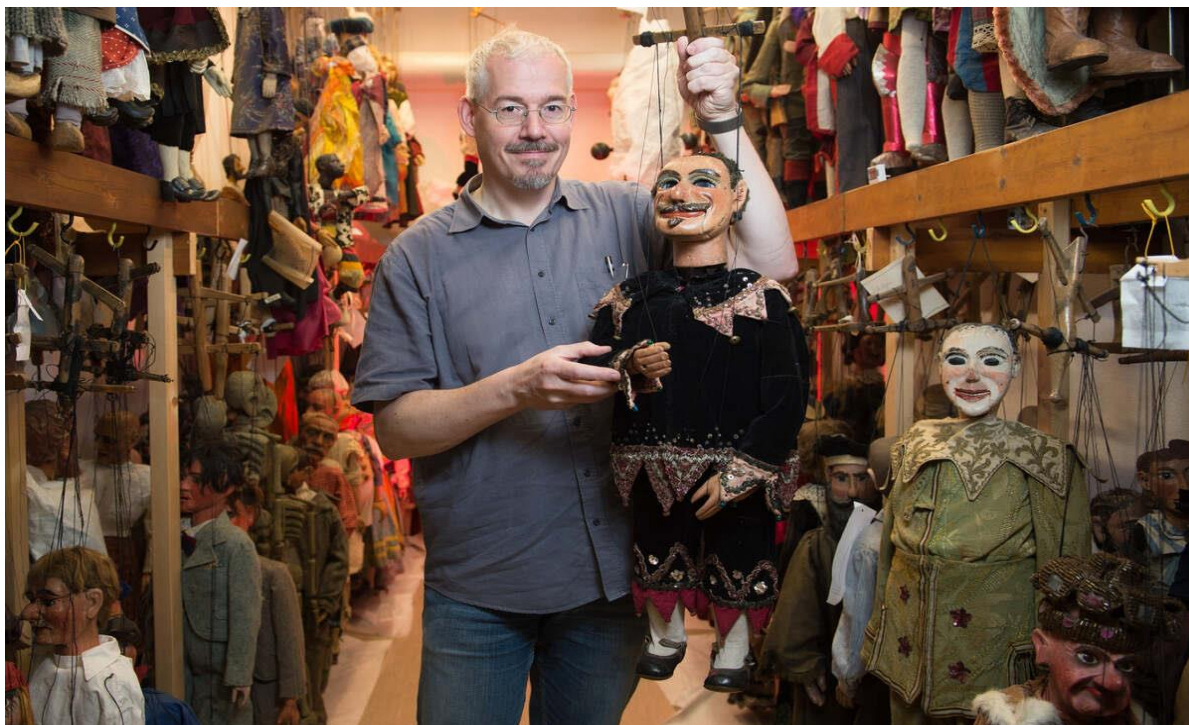
مجموعه تئاتر عروسکی

مجموعه تئاتر عروسکی در سدن که سالها در انبار یک کلیسا نگهداری می شد تا سال ۲۰۲۳ میلادی صاحب موزه می شود.