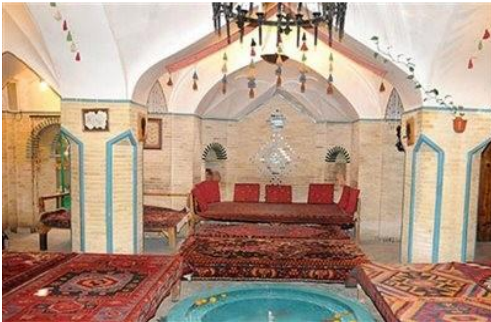
گرمايه حاج داداش

يکي از بناهاي تاريخي ارزشمند در زنگان، گرمايه حاج داداش است. اين گرمايه، مثال خوبي از مدل معماري ايراني مي باشد. البته اکنون به شکل سفره خانه سنتي درآمده و تغيير کاربري داده است. فضاي گرمايه حاج داداش بسيار مفرح و دلنشين است و آرامش خاصي در دل دارد. قدمت بناي حاج داداش به حدود ۲۰۰ سال قبل برمي گردد؛ اما همچنان زيبا و پابرجاست. اگر مي خواهيد با هنر ايراني ها و مدل معماري سنتي ايران آشنا شويد، به گرمايه حاج داداش در دل بازار زنگان برويد.