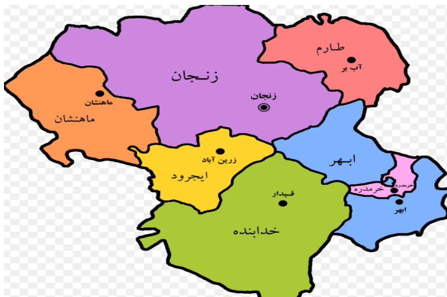
نقشه شهرستان‌های استان زنجان

زنجان، قرار دارد که فاصله کمی هم باهم دارند. راستی در غرب و جنوب غرب زنجان هم استان کردستان قرار دارد. همه اینها یعنی زنجان موقعیتی استراتژیک و منحصربفرد دارد. در استان زنجان، شهرستان‌هایی با جاذبه‌های متنوع گردشگری قرار دارد. ابهر، ایجرود، خداپنده، زنجان، طارم، خرمدره و ماهنشان از جمله شهرستان‌های استان زنجان هستند.