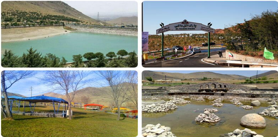
مجموعه ائل داغی

در شمال زنجان، یک مجموعه تفریحی و کوهستانی بسیار زیبا و سرسبز به نام «ئل داغی» یا «گاوازنگ» قرار دارد که برای تفریح کردن عالی است. این منطقه تفریحی در دل کوه گاوازنگ قرار دارد. با رفتن به ائل داغی هم می توانید کوهنوردی کنید و هم می توانید از طبیعت زیبا و سبز کوه گاوازنگ لذت ببرید. در ائل داغی، امکانات تفریحی متعددی وجود دارد و همه چیز برای تفریح و لذت بردن شما مهیا است. در گاوازنگ، می توانید از پیست دوچرخه سواری، چایخانه، آمفی تئاتر، مجموعه ورزشی و لند مارک که جزو امکانات رفاهی این منطقه تفریحی است استفاده کنید و لذت ببرید.