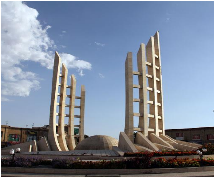
میدان انقلاب زنجان

خیلی ها از جمله خود من، دوست دارند بدانند که چرا زنجان به این نام انتخاب شده است؟ تا به حال، بسیاری از پژوهشگرهای ایرانی، درباره دلیل نامگذاری این اسم روی شهر زنجان صحبت کرده اند. یکی از نظرات موثق برای این موضوع، متعلق به «حمدالله مستوفی»، تاریخ نگار مشهور ایرانی می باشد. وی ریشه زنجان را با زندیگان (زند + گان) به معنی پیروان کتاب زند مرتبط می داند. کتاب زند، یکی از معروف ترین کتاب‌های آیین زرتشتی در دوران ساسانیان بوده است. به مرور زمان، زندیگان به زنجان تغییر کرد و این نام روی این شهر تاریخی ماندگار شد.