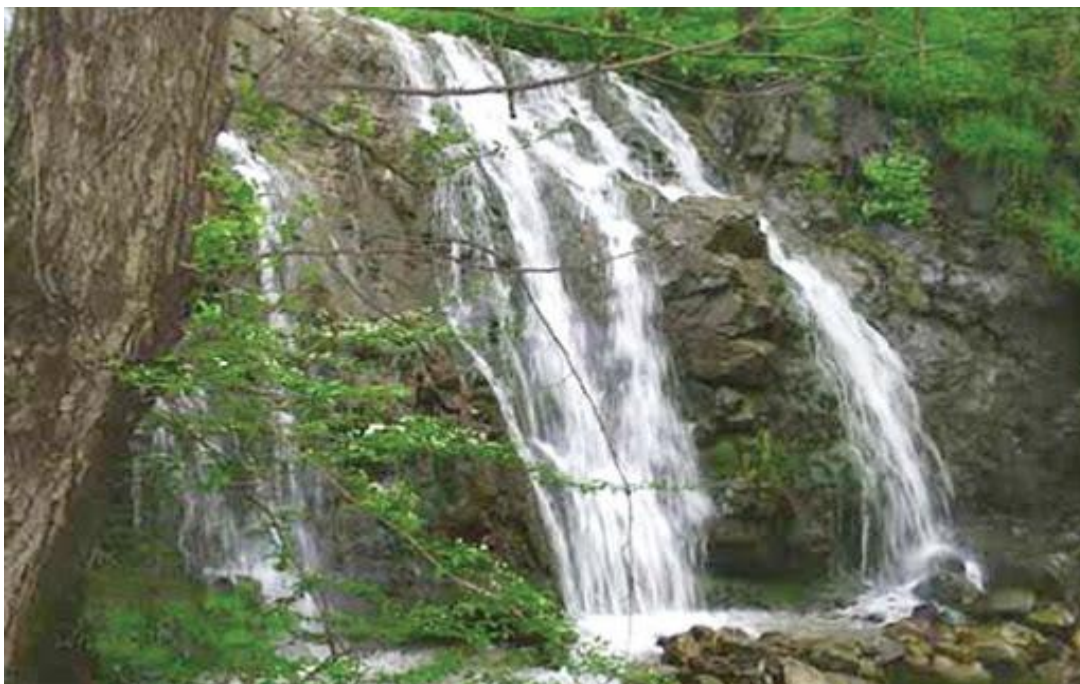
آبشار شار شار