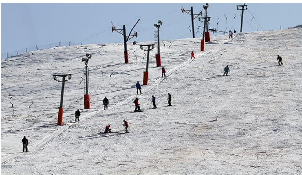
پیست اسکی پاپایی

دوست دارید در سفر به زنجان، کمی برف بازی کنید؟ «پیست اسکی پاپایی»، مکان مناسبی برای دوستداران اسکی و برف بازی است. برای رفتن به پیست اسکی پاپایی، باید به سمت شهرستان ایجرود حرکت کنید. خوبی پیست اسکی پاپایی این است که شیب ملایمی دارد؛ در نتیجه افراد غیرحرفه ای و مردم عادی هم می توانند در آن تفریح کنند. پیست پاپایی با ۸۰ هکتار فضا، مکانی عالی برای عاشقان ورزش های زمستانی و مناسب برای کودکان و بزرگسالان است. با رفتن به این منطقه، می توان کلی تفریح کرد و عکس های یادگاری گرفت.