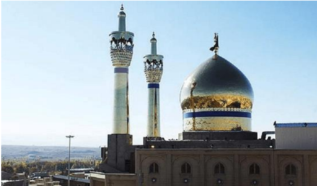
مسجد حسینیہ اعظم زنجان