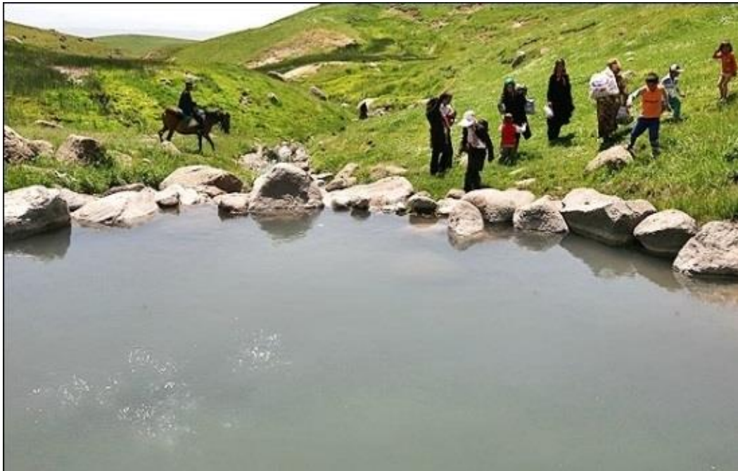
چشمه آب گرم آبدال

اگر می خواهید آب درمانی کنید و تنی به آب گرم بزنید، چشمه آب گرم آبدال زنجان را امتحان کنید. آب گرم آبدال در جاده زنجان به تبریز قرار دارد و در ارتفاعات کوه ابدال جاری شده است. آب گرم آبدال خاصیت درمانی دارد و می تواند مسکن خوبی برای زانودرد، کمردرد، گرفتگی عضلات و... باشد. چشمه آب گرم آبدال از آن مکان های دیدنی در زنجان است که حسابی حال تان را خوب می کند.