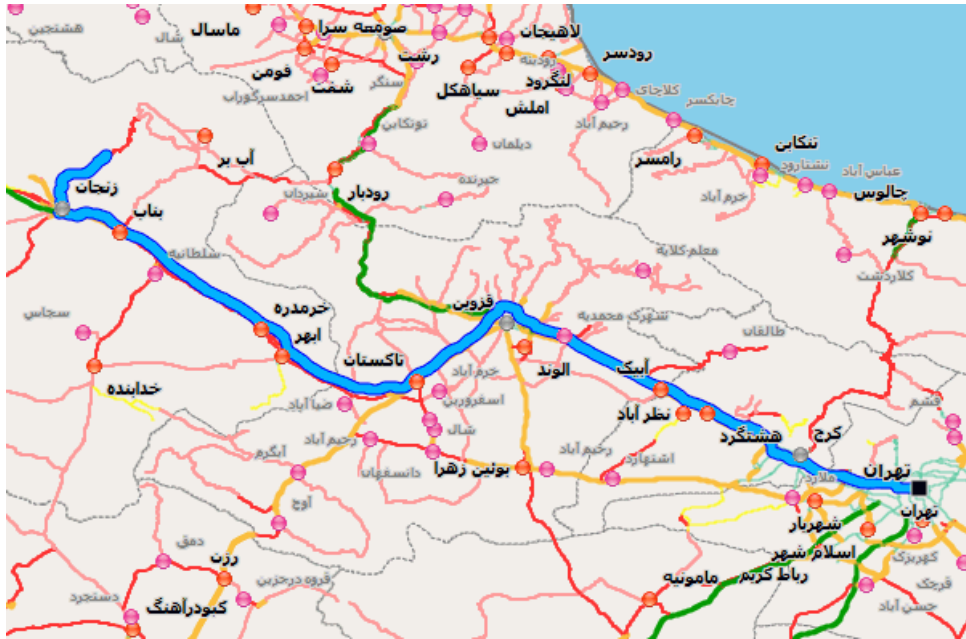
نقشه مسیر تهران-زنجان