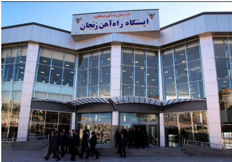
ایستگاه راه آهن زنجان

اگر هم می خواهید از مسیر بیشتر لذت ببرید و درگیر رانندگی نباشید، می توانید سوار قطار شوید. البته برای رفتن به زنجان با قطار باید سوار قطارهای تهران به تبریز شوید و در زنجان، از قطار پیاده شوید. خطوط راه آهن دیگری نیز برای سفر به این شهر تاریخی وجود دارد.