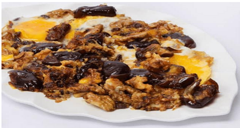
شش انداز زنجانی

اگر نزدیک به عید به زنجان سفر کنید، شانس خوردن خوراکی سنتی زنجان یعنی «شش انداز» را خواهید داشت که مردم زنجان، آن را در شب چهارشنبه سوری در ست می کنند. در شش انداز، گردو، کشمش، خرما، شیره انگور و پیاز وجود دارد که آن را بی نهایت مقوی و خوشمزه می کند.