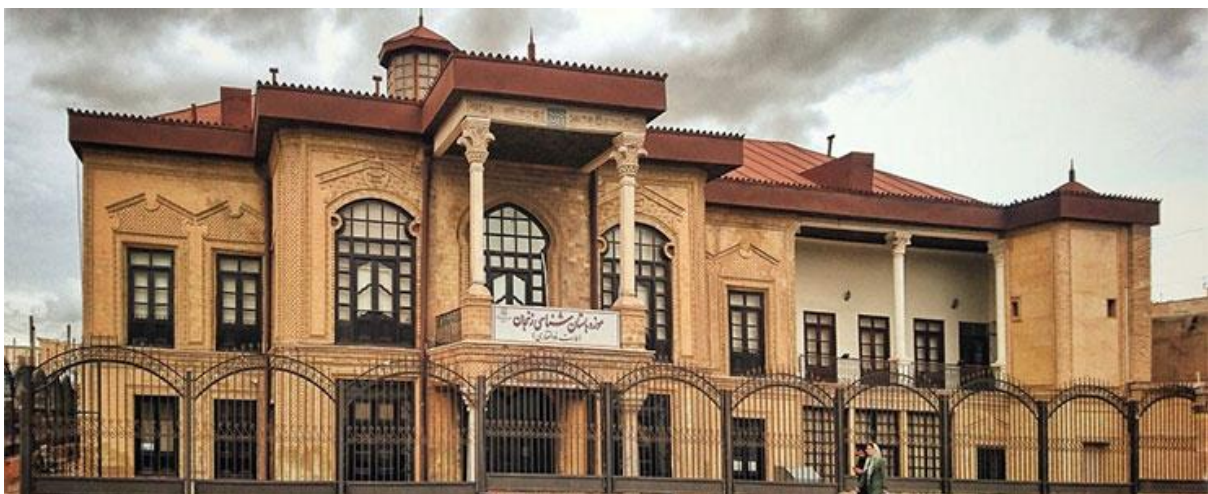
موزه باستان شناسی

وقتی به موزه رختشویخانه رفتید و آن را دیدید، ۵۰۰ متر قدم بردارید تا به موزه باستان شناسی زنجان برسید. در این موزه، جسد مومیایی مردان نمکی قرار دارد! موزه باستان شناسی در عمارتی قرار دارد که آن خانه در دوران قاجار ساخته شده است و ساختار قدیمی و زیبایی دارد. راستی، این موزه نیز در فهرست آثار ملی ایران ثبت شده است.