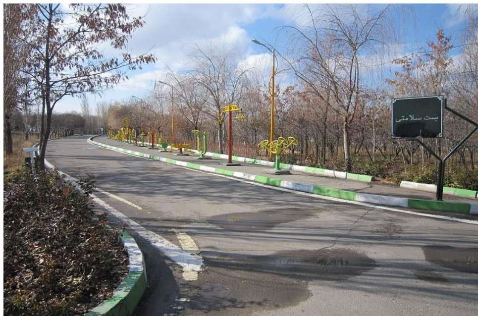
پارک جنگلی ارم

پارک جنگلی ارم، در ابتدای اتوبان زنجان به میانه قرار دارد. این پارک یکی از مکان‌های مناسب برای لذت بردن از طبیعت و چادر زدن است. در پارک جنگلی ارم، موزه تاریخ طبیعی شهر زنجان نیز قرار دارد و شما می‌توانید از آن بازدید کنید.