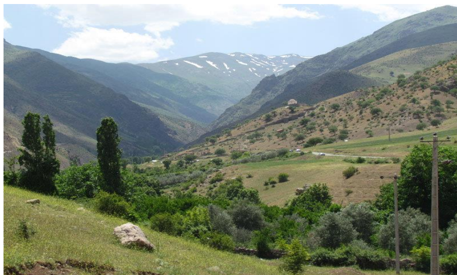
طبیعت مسیر زنجان-طارم

چهار فصل را می‌توان در زنجان، به خوبی احساس کرد. بهار زنجان، دلنشین است. در تابستان هوایش گرم و خشک می‌شود. پاییز هوای خنکی دارد و در زمستان هوایش سرد می‌شود. در ماه‌های اردیبهشت، خرداد و تیر آب و هوای زنجان فوق‌العاده عالی و دلپذیر است. بهار و تابستان زنجان بهترین فصل برای حضور گردشگران و علاقمندان به طبیعت است.