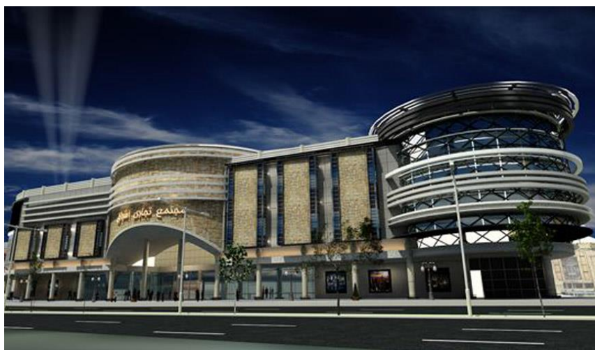
مجتمع تجاری اشراق

پاساژ تهران، نام یکی دیگر از مراکز خرید در زنجان است که در آن انواع کیف، کفش، لباس و وسایل برای سلیقه‌های مختلف وجود دارد و تنوع بالایی دارد.