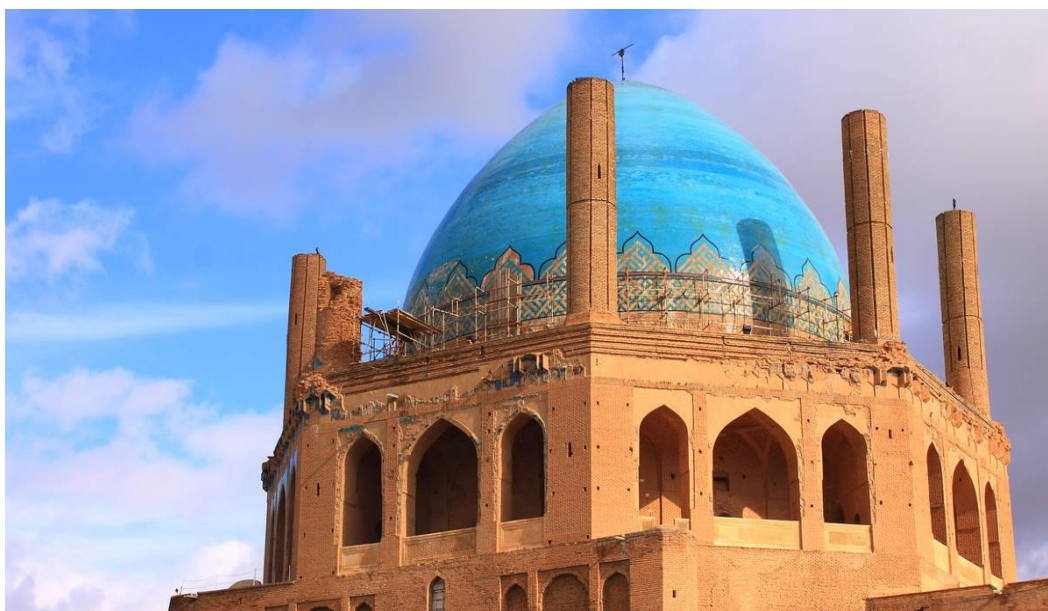
گنبد سلطانیه زنجان

اصلا نمی شود ایران باشید و از یکی از خاص ترین شهرهای ایران یعنی «زنجان» دیدن نکنید! اصلا اگر ایران را بگردید و زنجان را ندیده باشید، گردشستان را نیمه کاره بدانید. شهر زنجان با داشتن جاذبه های طبیعی و تاریخی منحصر بفرد، و موقعیت خاص جغرافیایی خود ظرفیت تبدیل شدن به یکی از قطب های بزرگ گردشگری کشور را دارا است. توسعه صنعت گردشگری زنجان نقشی اساسی در رونق اقتصادی این شهر اصیل و تاریخی خواهد داشت. در این نوشته می خواهیم درباره جاذبه های دیدنی زنجان با شما صحبت کنیم. از شما دعوت می کنیم تا پایان این نوشته جذاب، با ما همراه باشید.