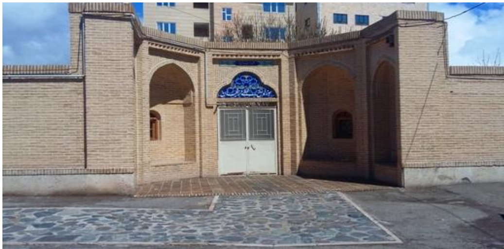
موزه نسخ خطی

البته دیدنی های زنجان به همین موارد محدود نمی شود و با سفر به این شهر زیبا، شما می توانید جاذبه های تاریخی و گردشگری بیشتری مانند خیابان سبزه میدان زنجان، موزه نسخ خطی، بلوار شیخ اشراق و... را نیز ببینید و لذت ببرید.