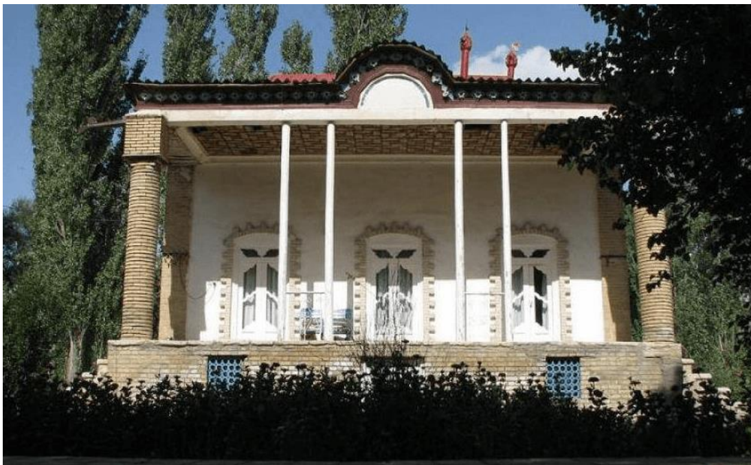
عمارت تاریخی معین

یکی از ثروتمندان زنجان در دوران قاجار، عمارت زیبای معین را ساخت. مدل معماری باغ و عمارت معین، کاملاً شبیه به قصرها و کاخ‌های پادشاهان قاجار است. وقتی به عمارت تاریخی معین بروید، حیاط بزرگی را در وسط باغ مشاهده خواهید کرد. در دو طرف عمارت، دو اتاق بزرگ قرار دارد. در عمارت تاریخی معین، ستون‌هایی را خواهید دید که با آجر و قالب‌های گچی تزئین شده است. جالب است بدانید که برای ساخت در و پنجره‌های باغ معین از چوب درخت گردو استفاده شده و بسیار خاص هستند. برای دیدن این شاهکار معماری، بهتر است خودتان به این مکان زیبا که در غرب پل سردار قرار دارد بروید و از نزدیک زیبایی‌هایش را مشاهده کنید.