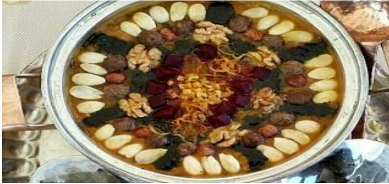
آش ترش زنجان

اگر بخواهم نام غذاهای سنتی زنجان را برای تان بگویم می توان به آش گندم، آش شیر، کله جوش، آش ترش، پیازو و خورشت آلوچه با مرغ اشاره کرد. خورشت آلوچه با مرغ زنجانی، یک ترکیب خوشمزه از طعم های ترش و شیرین است که شما را عاشق خودش می کند! البته این را هم بگویم که آش ترش زنجان هم بسیار خوشمزه و مقوی است؛ این آش خوش طعم جزو میراث فرهنگی ایران به حساب می آید.