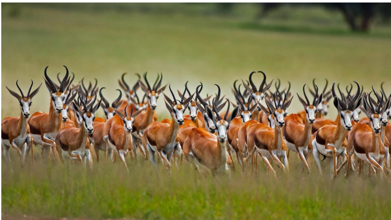
گوزن پارک بین المللی کالاهاری