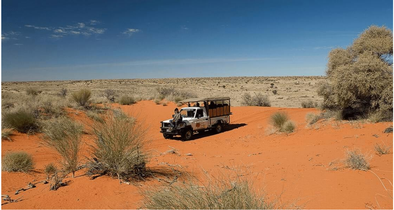
پارک بین المللی کالاهاری

با ادغام پارک ملی گمسیبوک کالاهاری آفریقای جنوبی و پارک ملی گمسیبوک بوتسوانا، پارک بین المللی کالاهاری یکی از بزرگترین مناطق گردشگری بیابانی در جهان تاسیس شد.