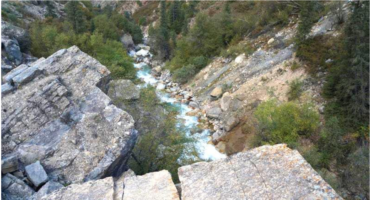
رودخانه پارک ملی قاراشورو

در پارک طبیعی چشمه های آب معدنی بی بدیلی وجود دارد که برای مسافران و گردشگران جنبه درمانی دارد. در پارک قارا شورو، یک موزه جانورشناسی وجود دارد که در ساختمان اداری پارک واقع شده است. در محدوده پارک هیچ هتل و اقامتگاهی وجود ندارد. نزدیکترین مجتمع رفاهی به نام زاش-۱۵ در فاصله ۳۰ کیلومتری از پارک واقع شده است. برای رسیدن به این مجتمع بایستی از مسیری کوهستانی و آسفالت نشده عبور کرد. این مسیر بیشتر در تابستان ها قابل استفاده است. در بهار و زمستان به دلیل بارندگی های شدید، جاری شدن گل و لای، ریزش سنگ قابل دسترسی نیست. این منطقه تفریحی برای گشت و گذار شهروندان محلی و گردشگران خارجی در نظر گرفته شده است. چشمه های آب معدنی در این منطقه واقع شده است.