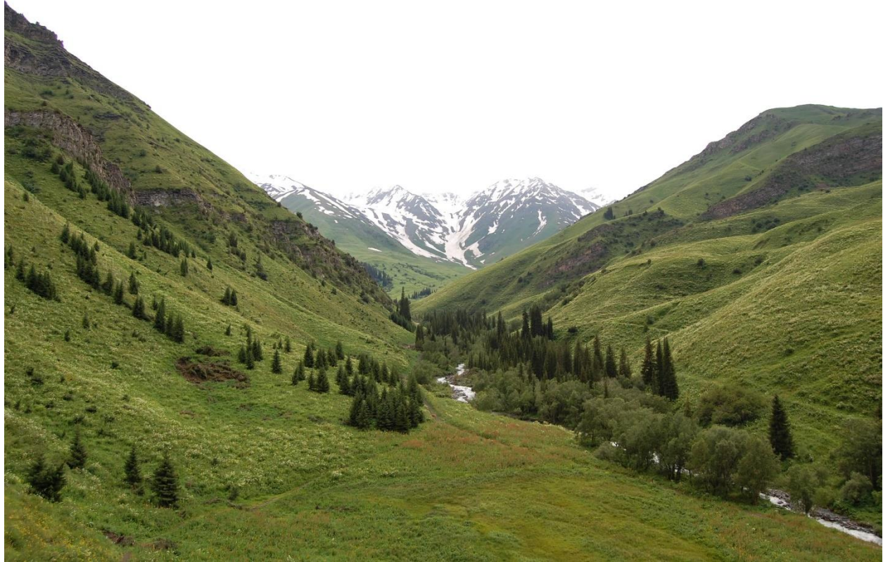
پارک ملی قارا شورو

مستقیم توده های هوای قطبی سرد که از شمال و شمال شرق می آیند، محافظت می کند. با تغییر ارتفاع دمایی؛ مدت فصل رویش، میزان بارش، رطوبت هوا و سایر عوامل آب و هوایی تغییر می کند.