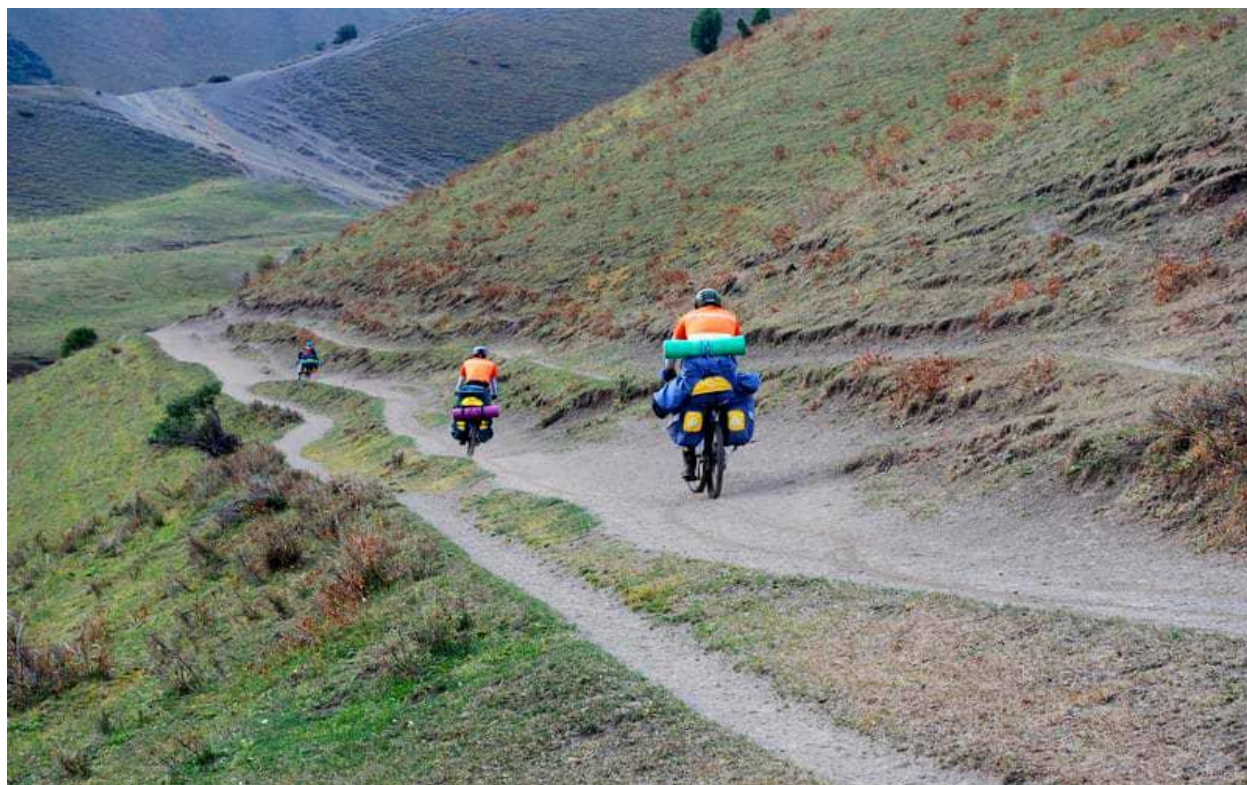
پارک ملی قاراشورو

پارک طبیعی دولتی قارا شورو در دامنه جنوب شرقی رشته کوه فرگانو در کوهستان تین شان واقع شده است. جایی که کوه هایی با قله های نوک تیز و پشته های صخره ای، دره های باریک و عمیق مانند تنگه ها و شیب های تند و بلند وجود دارد. شیب تند دامنه ها به ۳۵-۴۵ درجه و بیشتر می رسد. حداقل ارتفاع قلمرو پارک ۱۹۰۰ متر و حداکثر آن ۳۵۰۰ متر از سطح دریا است.