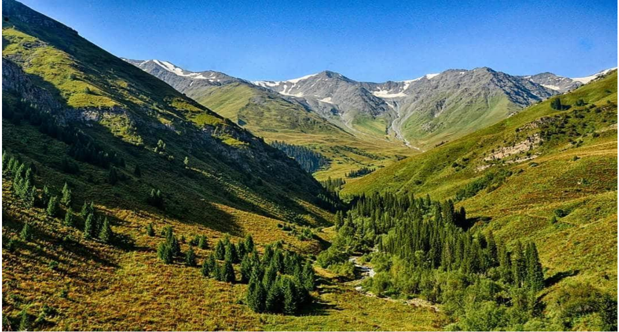
پارک ملی قارا شورو

پارک طبیعی قارا شورو با داشتن جاذبه‌هایی مانند رودخانه، چشمه‌های آب معدنی، درختان و گیاهان دارویی خاص، پرندگان و پستانداران کم‌نظیر یکی از جاذبه‌های گردشگری قرقیزستان به حساب می‌آید.