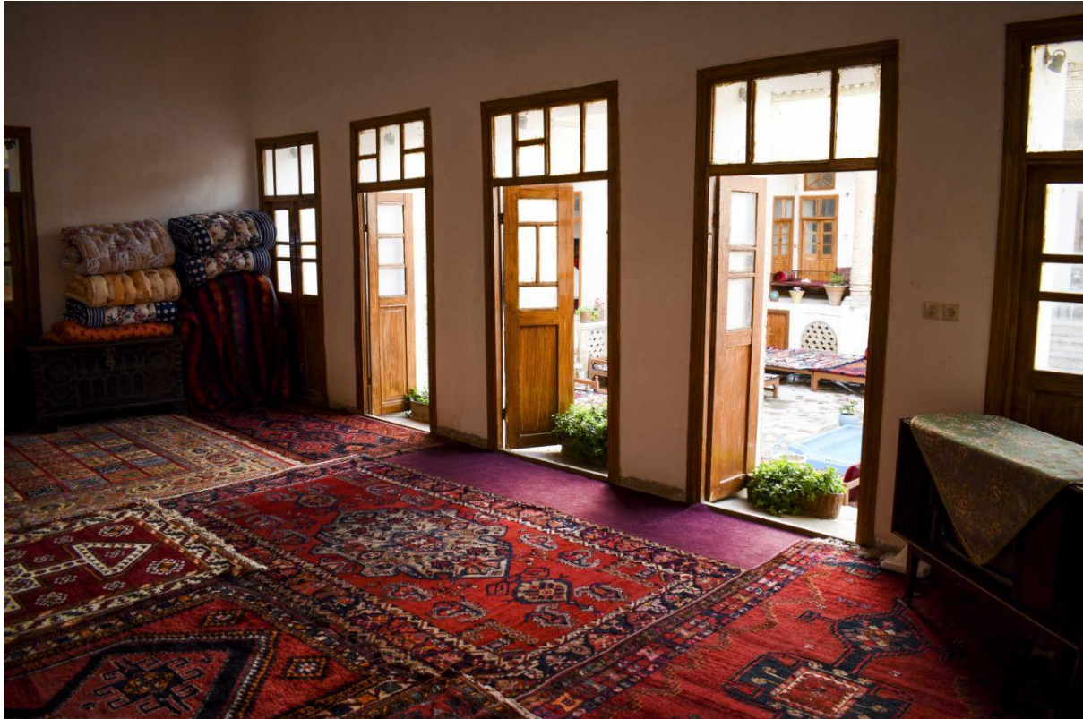
اتاق پنج دری

این عمارت چندین اتاق کف خواب سنتی با اسامی زیبا برای اقامت دارد. «اتاق پنج دری» با ظرفیت ۱۲ نفر، «اتاق سه دری بی بی» با ظرفیت ۴ نفر، اتاق «سه دری آخالو (به معنای دایی)» با ظرفیت ۶ نفر، «اتاق های زیرزمین» برای تورهای گروهی با ظرفیت ۱۸ نفر که حمام و آشپزخانه ی مجزا هم دارد.