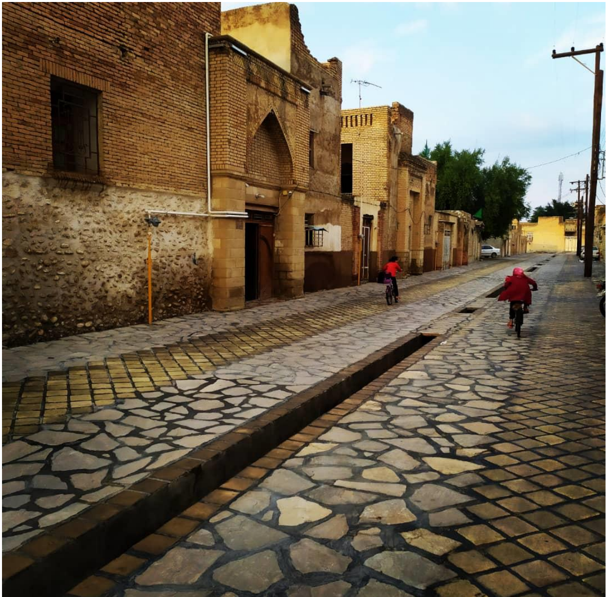
کوچه ی ملامحسنى ها

کوچه ی «ملامحسنى ها» از قدیم محل استقرار بازرگان ها و تجاری بوده که اقلامی مثل روغن محلی، فرش و خرما و چیزهای دیگر را با عشایر، روستایی ها و یا همشهری های خود داد و ستد می کردند. «عمارت چهل دری» در این کوچه، خانه ای با حیاط مرکزی و حوض زیبای فیروزه ای است که احتمالاً در حاشیه ی یک قنات قدیمی بنا شده است. سطح بالای آب باعث می شود چاهی که داخل یکی از زیرزمین های این بنا قرار دارد همیشه پر آب باشد. با وجود بادگیری که روی آن ساخته شده، در برابر هوای گرم، مثل کولر آبی عمل می کند.