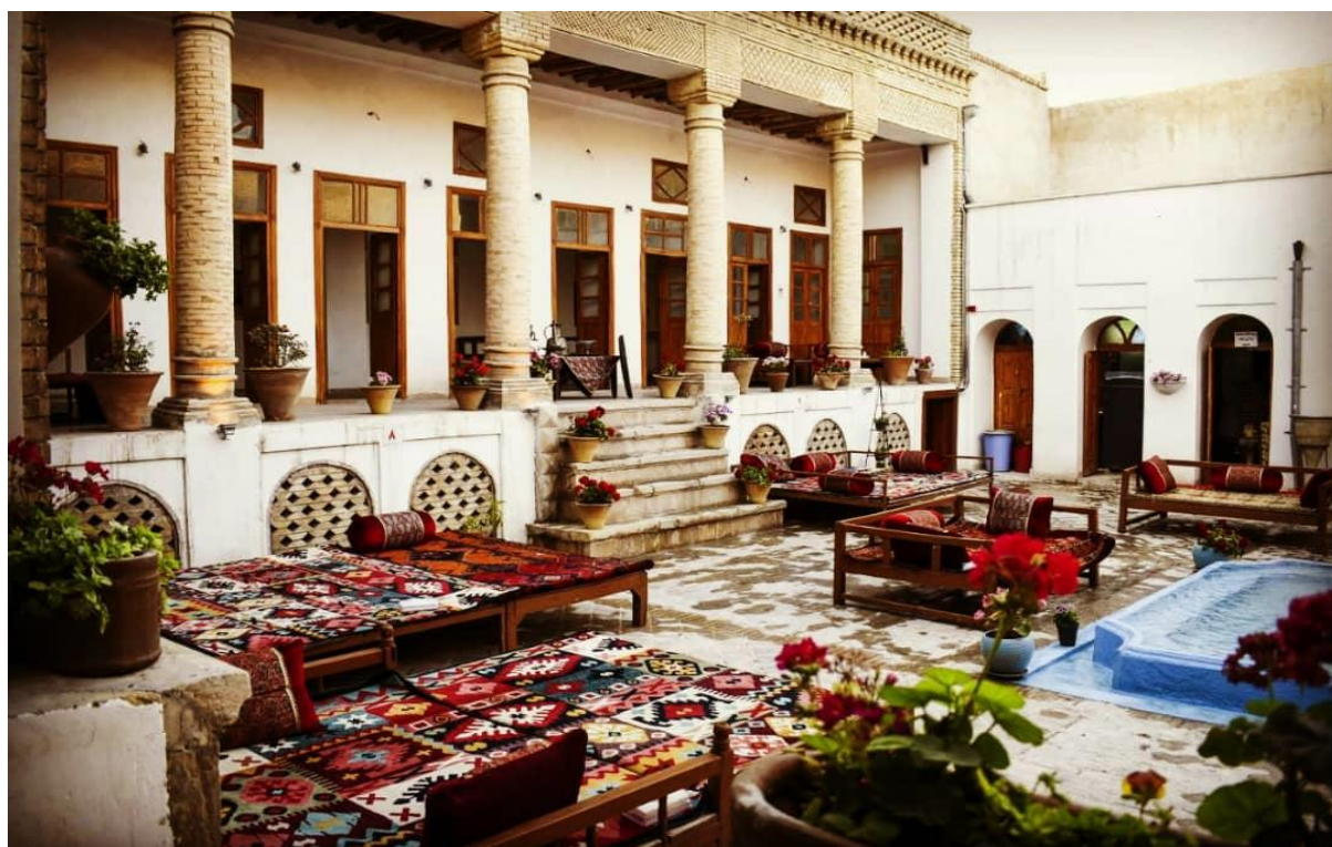
حیاط «عمارتِ چهل‌دری»

«عمارتِ چهل‌دری» خانه‌ای با معماری و آجرکاری قدیمی است که قدمت آن به دوره پهلوی اول باز می‌گردد. چهل دری در واقع اولین اقامتگاه بومگردی منطقه به حساب می‌آید.