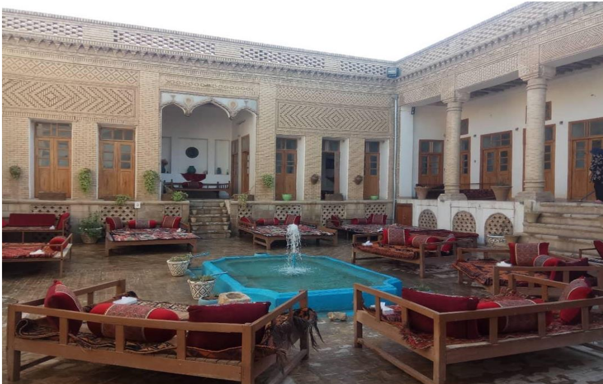
فضای بیرونی «عمارت چهل دری»