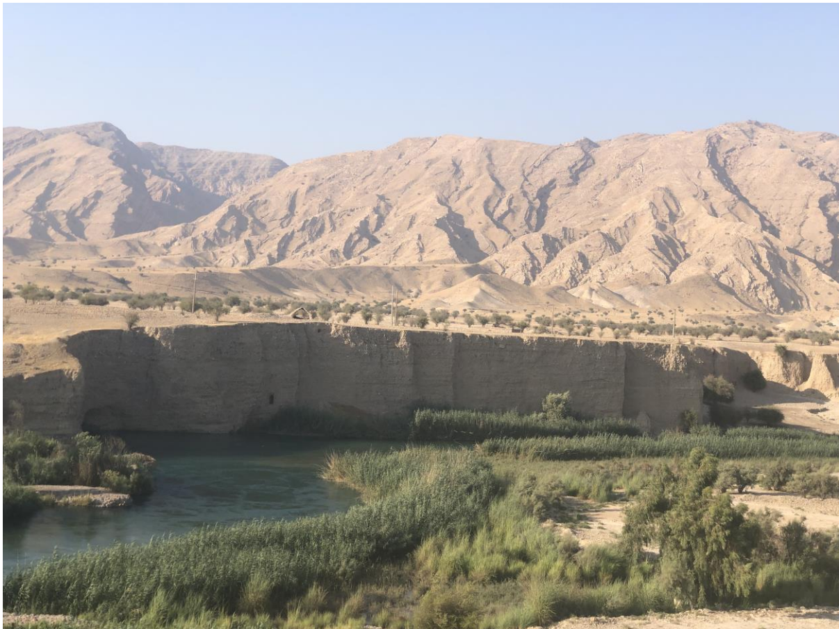
محوطه ی باستانی ارجان