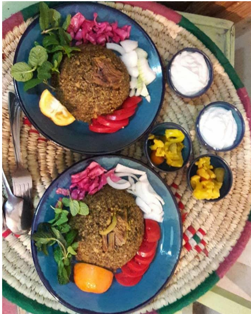
کوبینه، غذای سنتی بهبهان