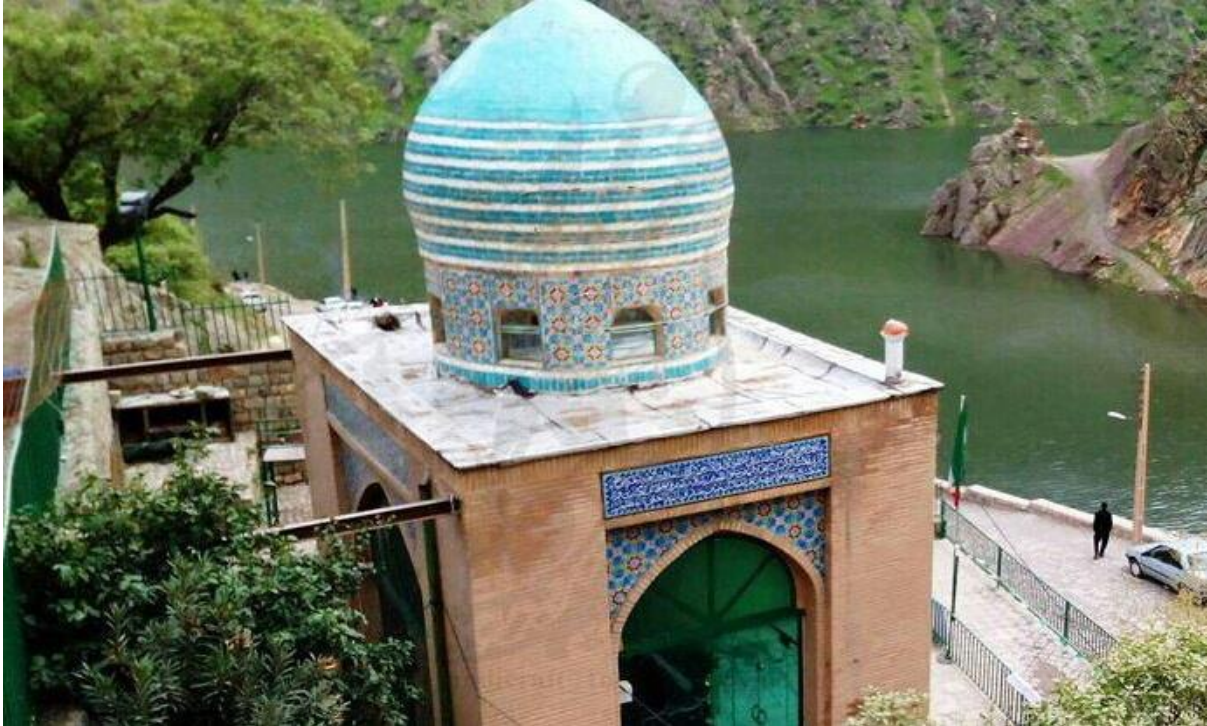
بقعه امامزاده در هجیج

این روستا جاذبه های دیگری مثل بقعه امامزاده و مسجد جامع و جاهای دیگری نیز داشت که فرصت بازدید از آنها را نداشتیم.