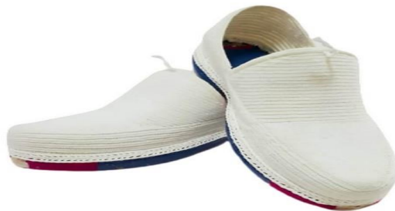
کلاش - گیوه

مردم این روستا مثل سایر روستاها شغل‌های روستایی مثل دامپروری داشتند؛ اما صنایع دستی هم شغلی ویژه در این روستا به حساب می‌آمد. به طوری که اکثر گردشگران حداقل کفش دست دوز «کلاش» را بخاطر ظاهر زیبا و خاص آن از روستایی‌ها می‌خریدند. این کفش که نوعی گیوه است پای چپ و راستش فرقی نمی‌کند و به هر صورتی می‌توان آن را پوشید.